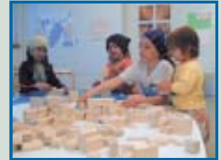
Arkkitehtuurikasvatusta Alvar Aalto -museossa.