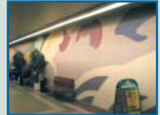
Cygnaeuksen koulun käytävän kattomaalaus. Urho Lehtinen 1925.