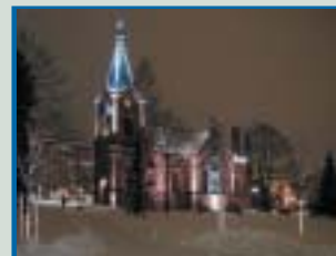
Gummeruksenkatu, Kunnallistalo. K.V. Reinius 1899.