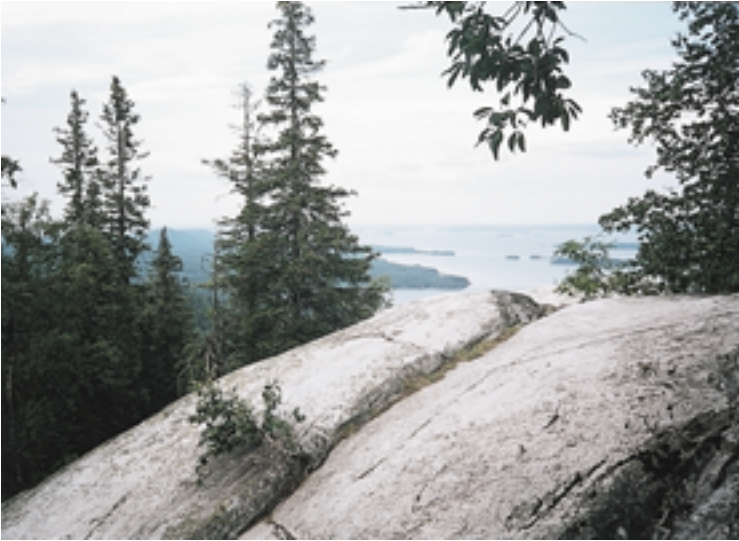
13. Kolin rakentamaton kansallismaisema.