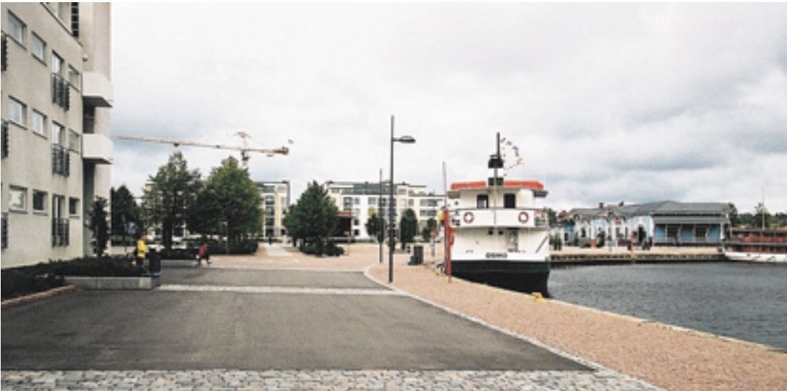
14. Kuopion satama on herännyt uuteen elämään yhdistäen modernia arkkitehtuuria, makasiinien perinteellistä puusepäniloaa, funktionalismin varastorakennusten asuntouuskäyttöä sekä järvellistä torielämää.