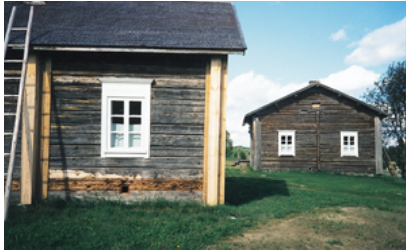
6. Mekrijärven Sissola, Ilomantsi.