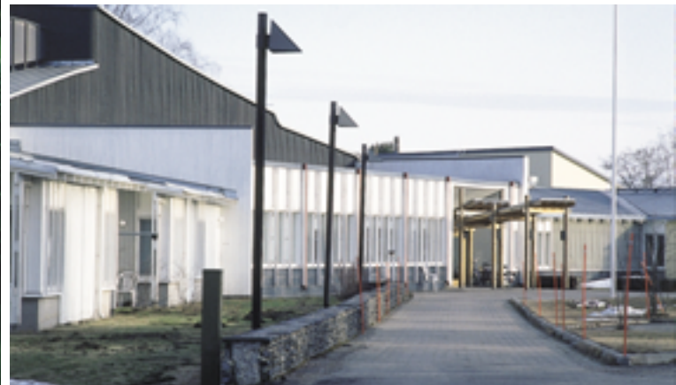
28. Juvan vanhainkodin palvelukeskus ”Juvakoti” perustuu kutsukilpailun voittaneeseen ehdotukseen. Kirsti Sivén 1991.