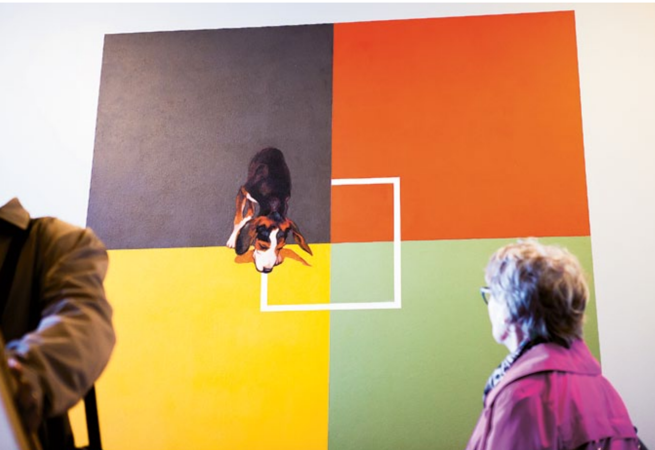
Oulussa prosenttiperiaatetta on noudatettu jo vuosikymmeniä, mikä on mahdollistanut taiteen tilaamisen arkisiin ympäristöihin. Raimo Törhösen seinämaalaussarja Ajokoiravärioppi sijaitsee Oulussa Kontinkankaan hyvinvointikeskuksessa. KUVA Aino Salmi ©Kuvasto 2015