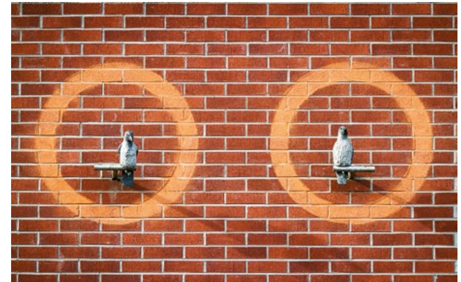
Pertti Kukkosen teos Variksen peli (2012) on integroitu asuinrakennuksen julkisivuun. Teos sijaitsee Tampereella Vuoreksen kaupunginosassa. KUVA Niklas Kullström ©Kuvasto 2015